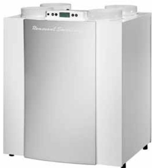
Renovent Excellent 300/400